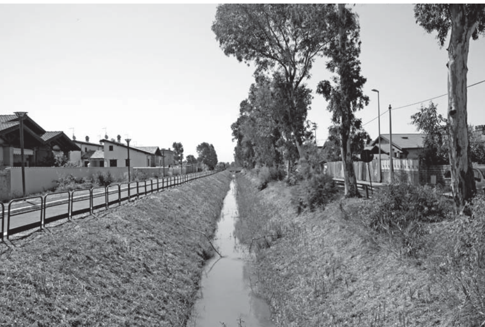
Un canale di bonifica nel quartiere di Saline (Roma).