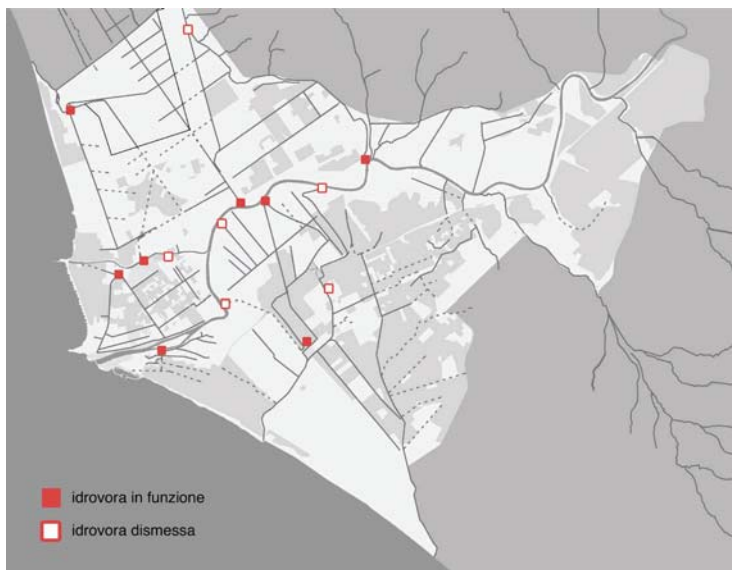
1_ Il sistema idrografico nella Coda della cometa. Mappa dei canali tombati (in alto) e delle idrovore (in basso).