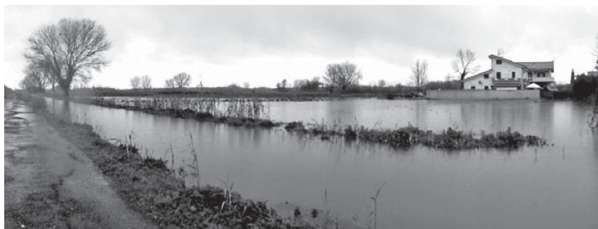
2_ Lo straripamento di alcuni canali durante un'alluvione, 2014.