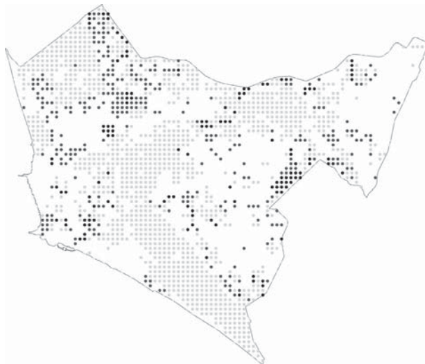
1_ Paesaggi dello scarto agricolo: in nero, aree incolte a vegetazione igrofila; nelle tre tonalità di grigio, dal più scuro al più chiaro: aree semi-naturali di recente abbandono, aree incolte a vegetazione erbacea; tutte le altre aree libere.