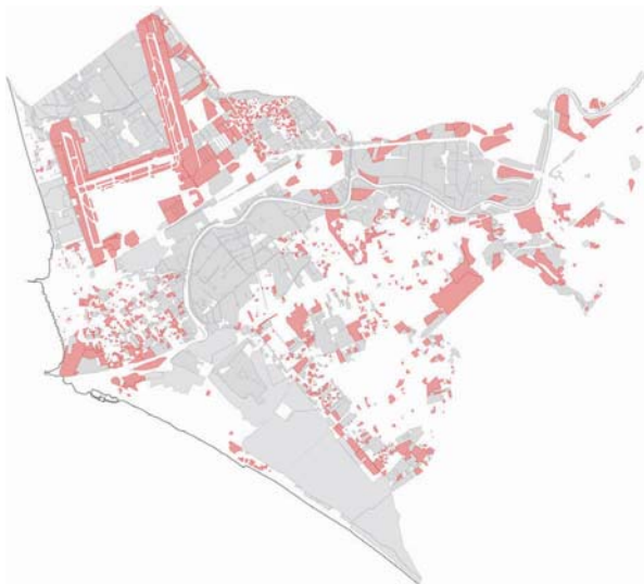
5_ Aree dello scarto agricolo e insediativo. Evidenziate in rosso, le aree permeabili coinvolte dalle dinamiche di abbandono della produzione agricola, degrado del suolo e avanzamento di processi insediativi; in grigio, tutte le altre.