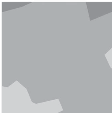
Corine Land Cover 2006