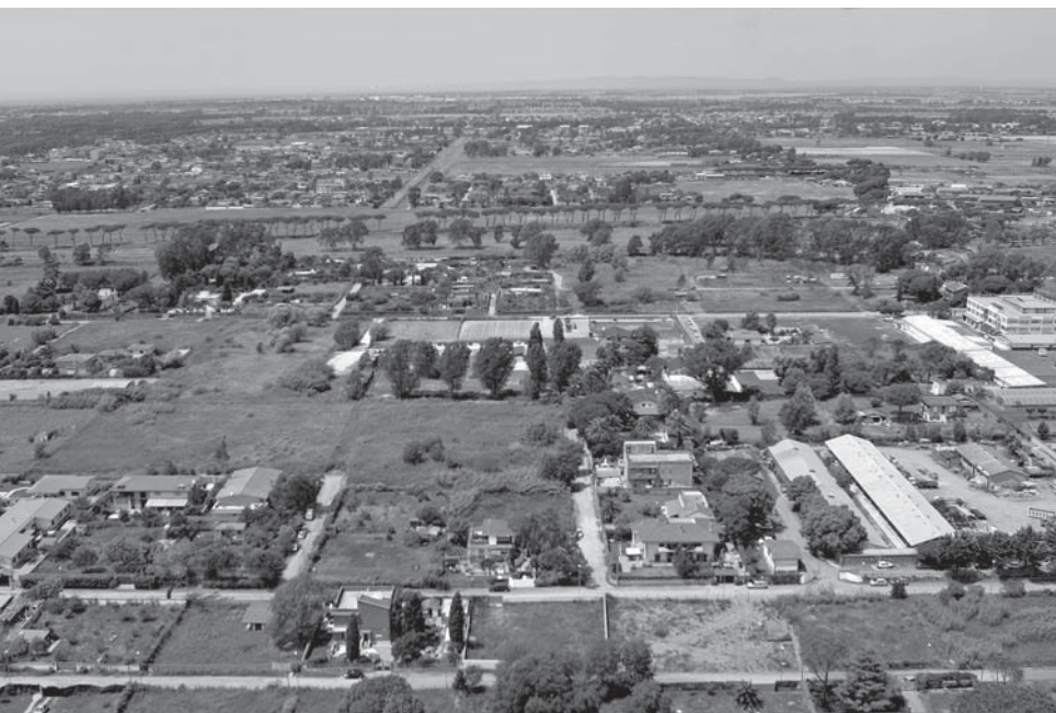
Greenfields, Casal Palocco – Castel Fusano.