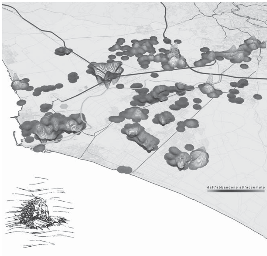
2_ Il drossmapping della Città inversa. L'elaborazione evidenzia "tridimensionalmente" quella parte del territorio abbandonata o sacrificata all'accumulo di rifiuti.